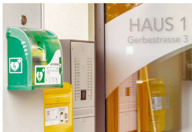
Der Defibrillator befindet sich an der Gerbestrasse 3/5 in Einsiedeln.

Gemäss Rettungsfachleuten sinken die Überlebenschancen ohne Reanimation – d.h. ohne Herzdruckmassage und Defibrillation – pro Minute um jeweils zehn Prozent.