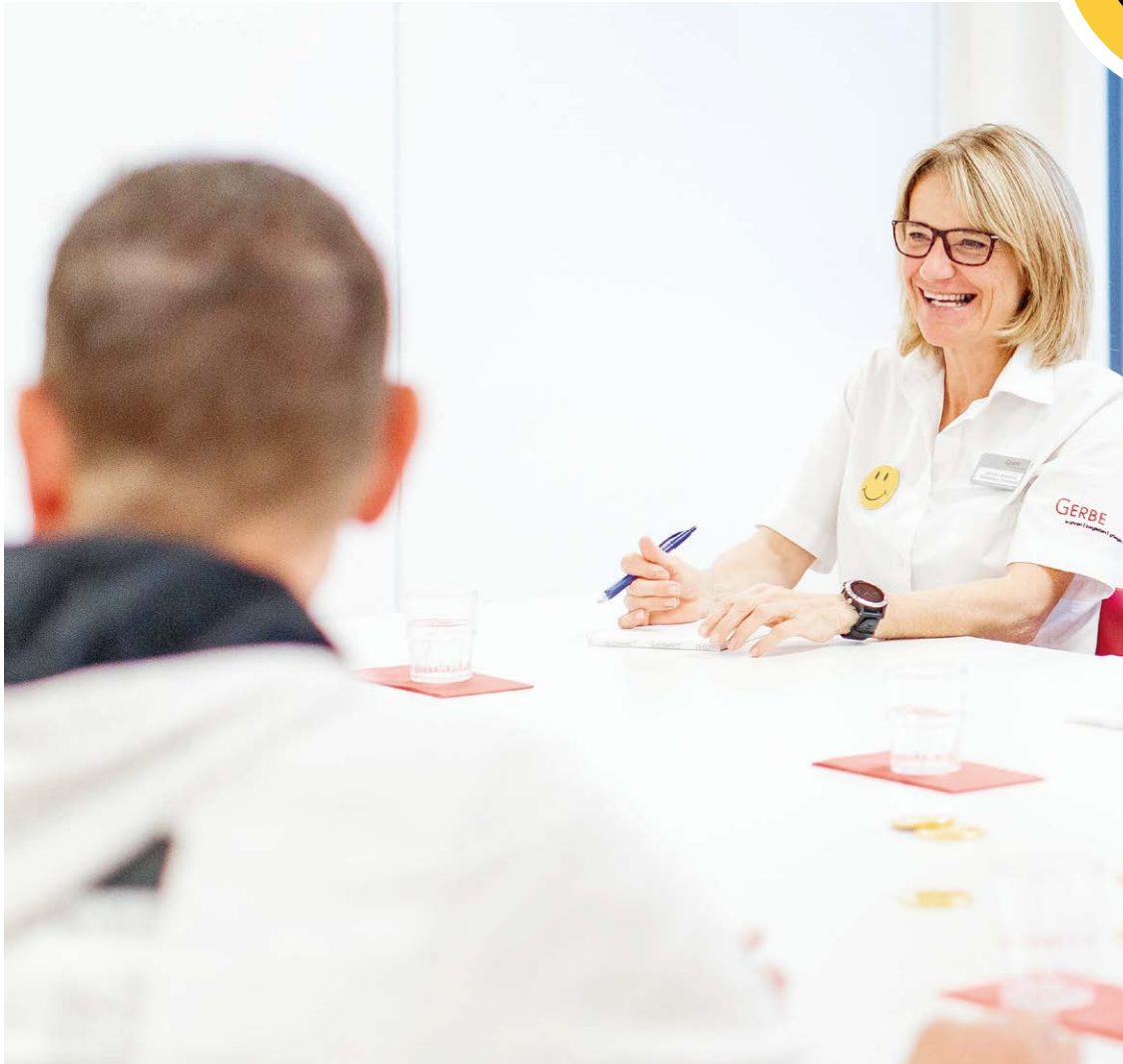
Aufgeräumte Stimmung an einer Sitzung des GERBE-Gesundheitszirkels.

Im Rahmen ihres betrieblichen Gesundheitsmanagements investiert die GERBE gezielt in die Erhaltung und Förderung der Mitarbeitendengesundheit.