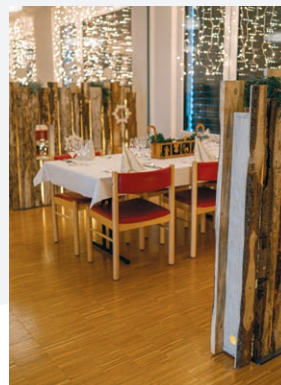
Essen & feiern Seite 7