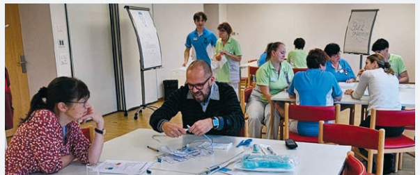
Für die Pflegemitarbeitenden finden mehrmals jährlich Aktionstage statt. An einzelnen Stationen können sie innerhalb von nur 30 bis 45 Minuten ihr Wissen auffrischen. Auf dem Foto geht es um Pflegestandards, z. B. bei der Körperpflege.