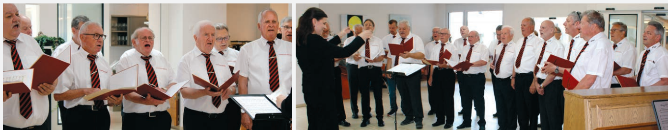
4. Mai: Die Mitglieder des Männerchors Einsiedeln leisten vollen Einsatz.