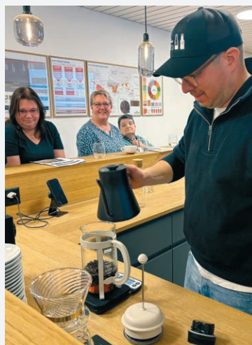
Das Gastroteam bildet sich in der Einsiedler Kaffeerösterei Drei Herzen, von wo die GERBE ihren feinen Kaffee fürs ganze Haus und fürs Restaurant bezieht, weiter.