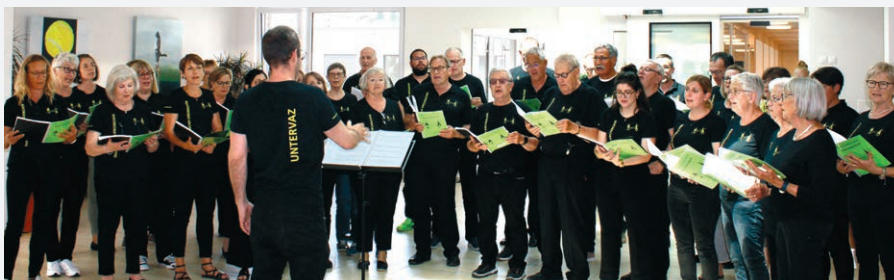
1. Juni: Der Ökumenische Kirchenchor Untervaz bringt gepflegte bündnerische Gesangskultur in die GERBE.