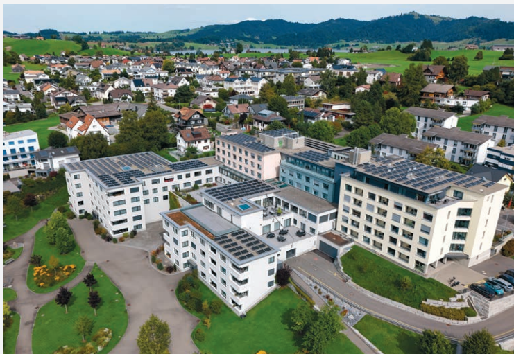
Der Blick von oben zeigt die 564 Photovoltaik-Module auf den GERBE-Dächern.

Seit dem 16. 7. 2025 verfügt die GERBE über ein eigenes Notstromaggregat mit einer Leistung von 240 Kilowatt. Das imposante Gerät liefert im Ernstfall sofort Elektrizität und gewährleistet auf diese Weise einen reibungslosen und sicheren Betrieb. Denn Stromausfälle können gravierende Auswirkungen haben – insbesondere in der Pflege und in der Gastronomie, wo eine lückenlose Versorgung der Bewohnenden