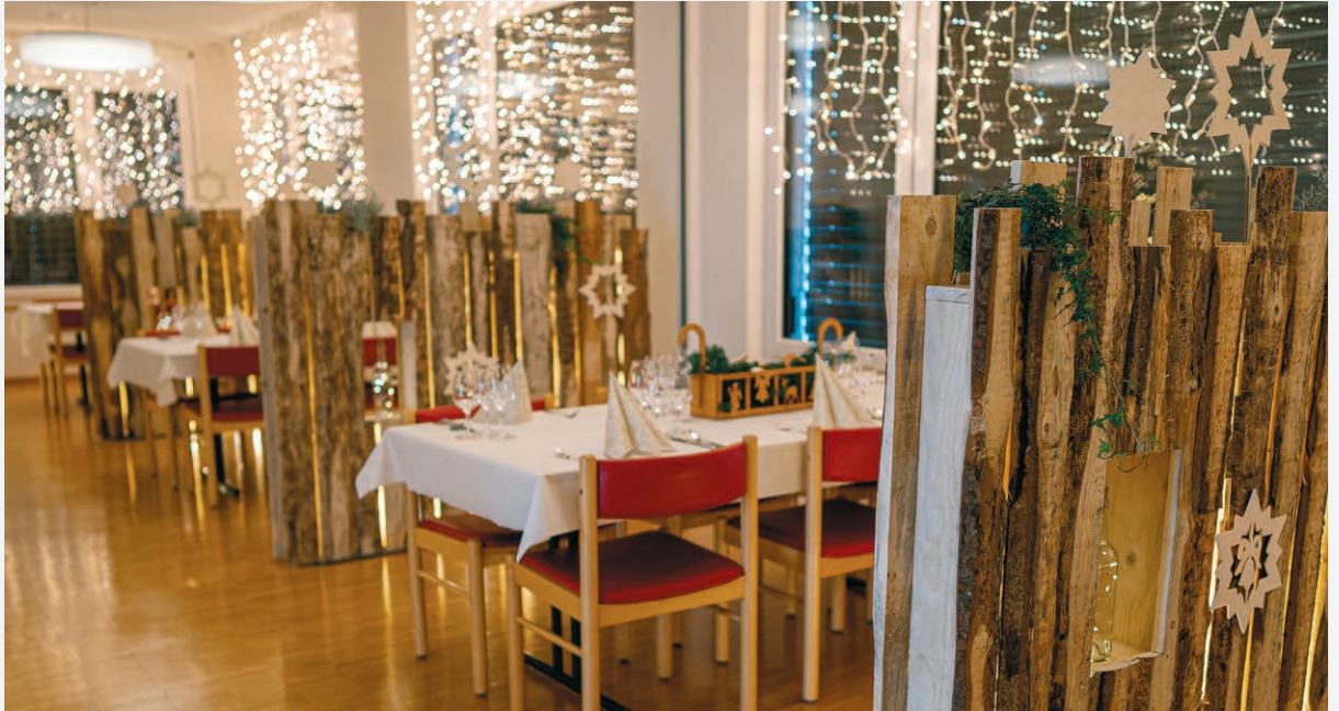
Die Nischen ermöglichen ein gemütliches Weihnachtsessen an einem frei wählbaren Tag zwischen dem 8. und 21. Dezember.

Seit einigen Jahren können die GERBE-Bewohnenden ihre Liebsten, Familienangehörigen, Freunde und Bekannten im Advent zum Weihnachtsessen im kleinen Kreis einladen.