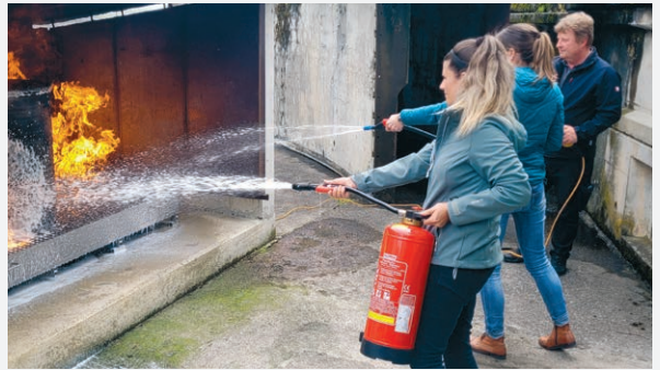
In der Übungsanlage für Feuerwehr und Zivilschutz in Seewen SZ üben GERBE-Mitarbeitende, wie sich ein Feuer schnell und gründlich löschen lässt.