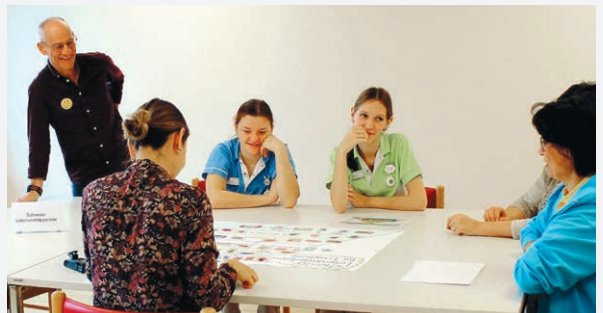
Hier befassen sich Pflegemitarbeitende mit Fragen rund um eine ausgewogene und gesunde Ernährung.