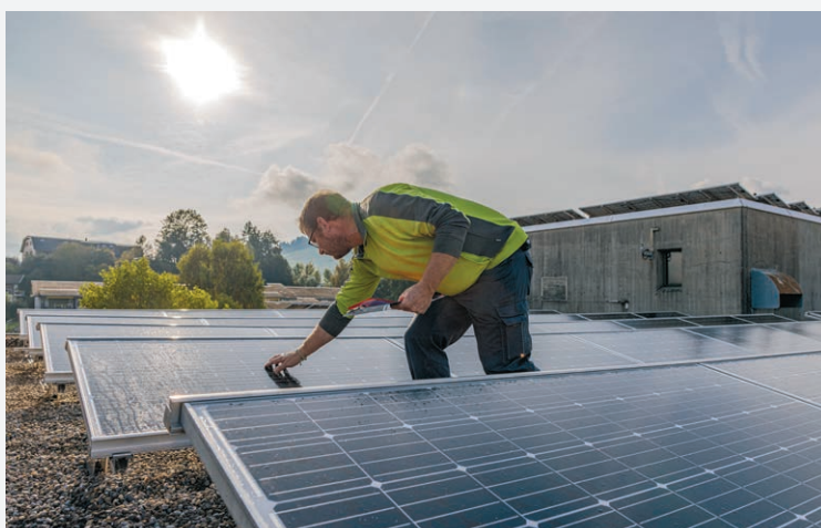
Am frühen Vormittag kontrolliert Lukas Graf, Leitung Technik & Betriebsunterhalt, auf dem Dach einige Photovoltaik-Module, damit sie an diesem sonnigen Tag auch maximale Leistung bringen können.

unerlässlich ist. Kein Strom bedeutet beispielsweise: kein Licht, keine Heizung, kein warmes Wasser, keine warmen Mahlzeiten und keine saubere Wäsche. Darüber hinaus kann das Notstromaggregat zur Netzstabilisierung vollautomatisch von Extern angesteuert werden.