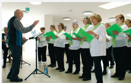
20. Mai: Der Chor «Insieme per canta» aus Lugano begeistert italienischsprachig.