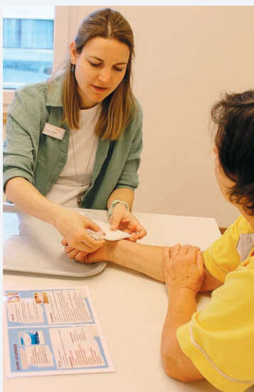
Mitarbeitende lernen, dass sich auch mit der nicht medikamentösen Wickel- und Aromatherapie viel erreichen lässt.