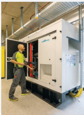
Fit & einsatzbereit Seite 4

Vor elf Jahren startete Bianca Amgwerd in der GERBE ihre Ausbildung. Bald schliesst sie das Studium zur Pflegefachfrau HF ab. Sie berichtet von ihrer erfolgreichen Laufbahn. Seite 2