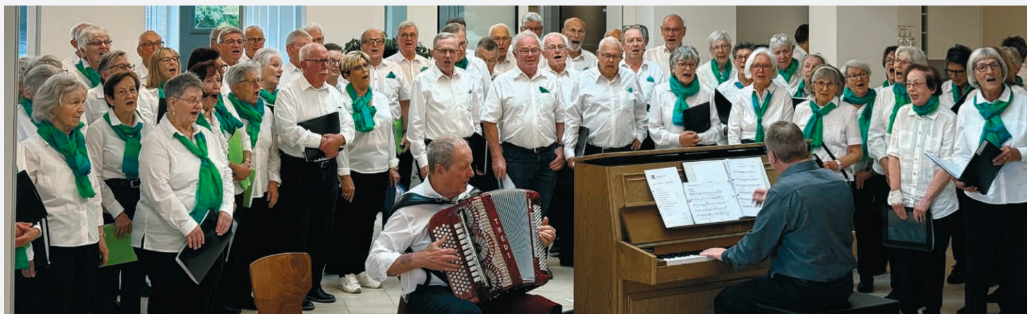
27. Mai: Gross, grösser, am grössten – das ist der stimmungswaltige Chor 60+ Ausserschwyz. Im GERBE-Restaurant hat es fast zu wenig Platz, um die zahlreichen Sängerinnen und Sänger unterzubringen.

GERBE. Nach dem Klosterbesuch singt er nachmittags in der GERBE. Schön, mal das Tessin mit seinen wunderbaren italienischsprachigen Liedern bei uns zu Besuch zu haben.