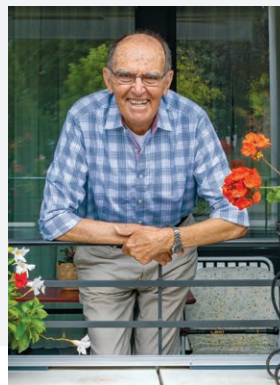
Bewegt & bewegend Seite 6