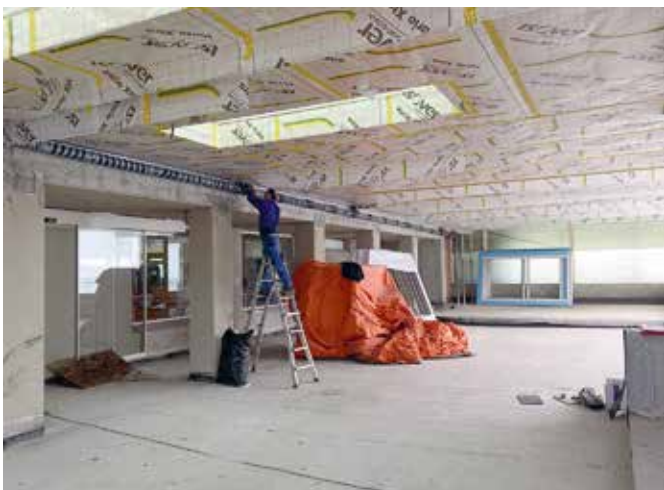
18. 4. 2017: Innenausbau Cafeteria/Restaurant.