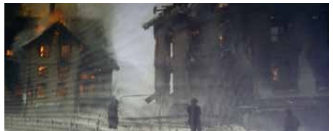
März 1975: Abbruch im Rahmen einer Feuerwehrrübung.