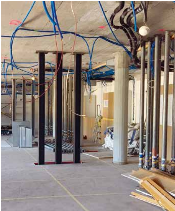
26. 5. 2017: Die Statik im Speisesaal wird verbessert.