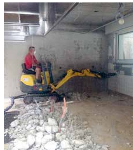
24. 8. 2015: Abbruch alte GERBE-Küche.