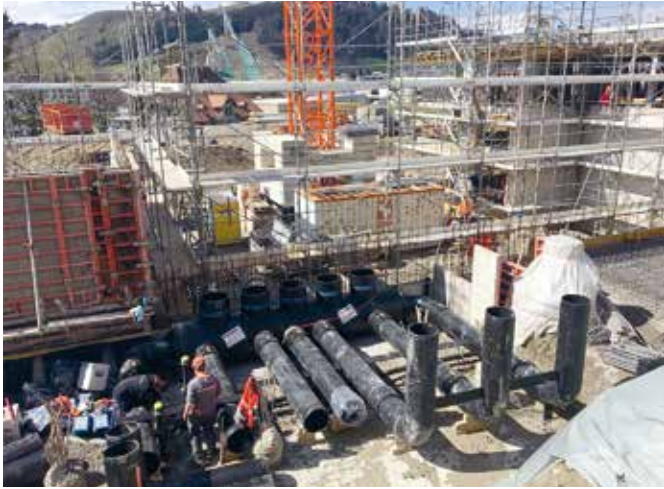
30. 3. 2016: Einbau Lüftungsrohre.