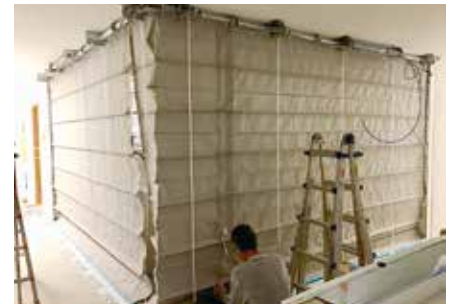
25. 11. 2016: Montage Brandschutzvorhang.