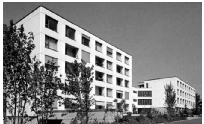
Die GERBE nach der Fertigstellung.