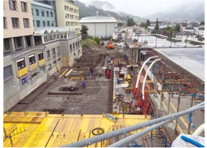
21. 6. 2016: Zwischen Bestand (l.) und Erweiterungsbau (r.).