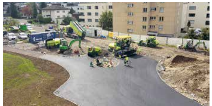
6. 9. 2017: Der GERBE-Park wird gebaut.