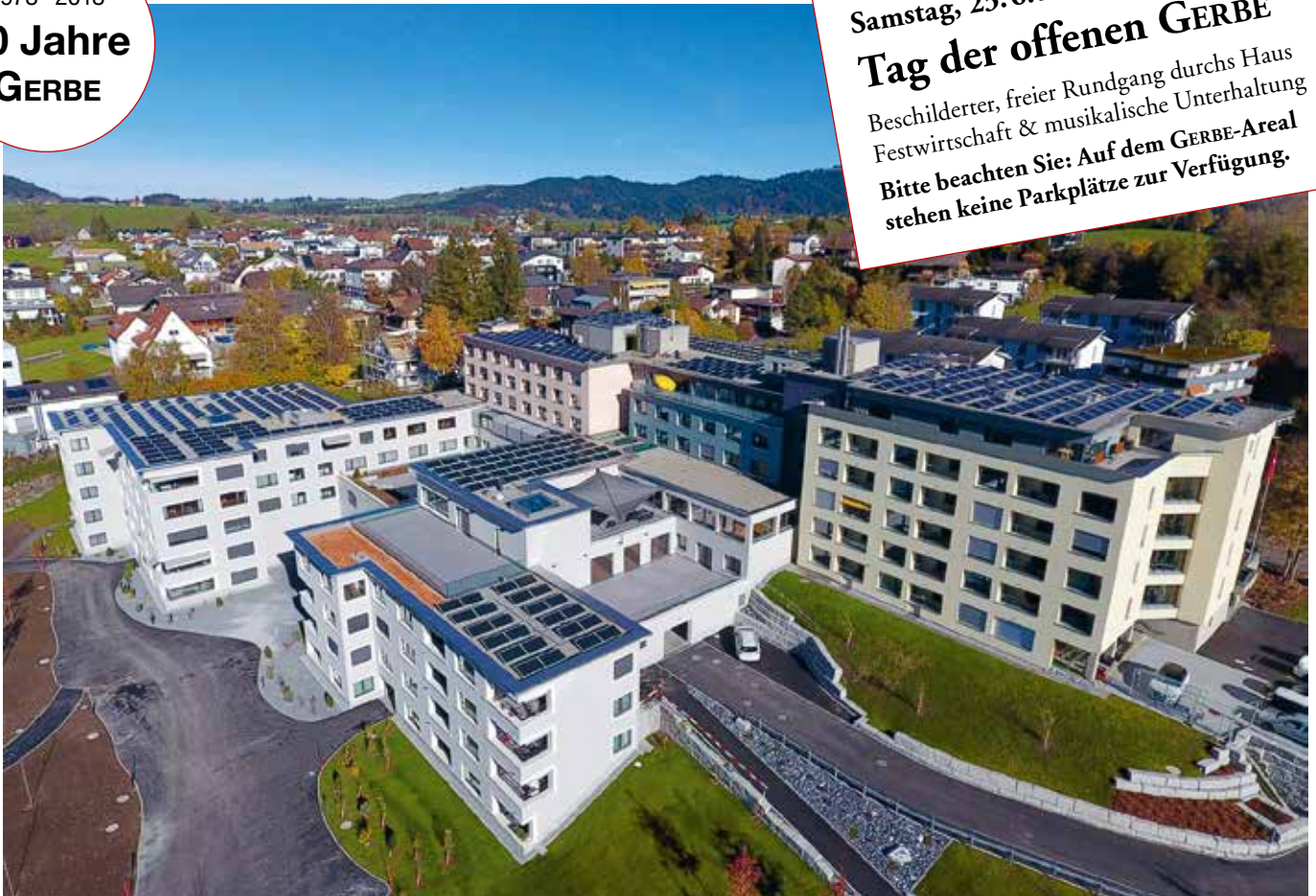
Die GERBE (bestehende Gebäude mit hellgelber, -blauer und rosa Fassade) mit den Erweiterungsbauten (hellgraue Fassade).

Bitte beachten Sie: Auf dem GERBE-Areal stehen keine Parkplätze zur Verfügung.