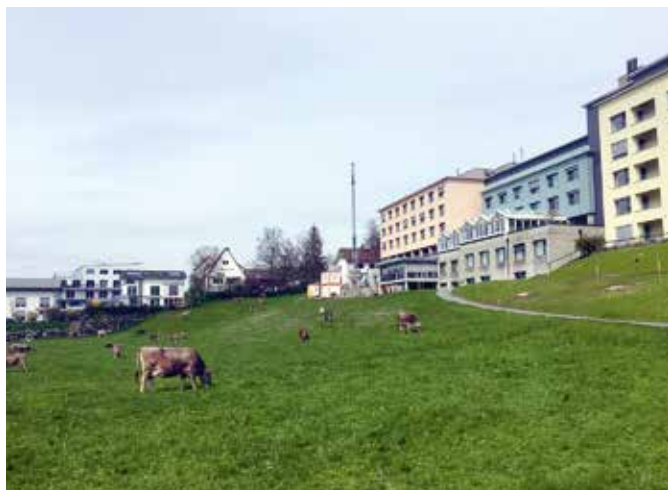
25. 4. 2015: Noch grasen Kühe auf dem Erweiterungsareal.

Von der ersten Idee für eine mögliche GERBE-Erweiterung bis zur effektiven baulichen Fertigstellung Ende 2017 verfloßen rund 13 Jahre. Auf den folgenden drei Seiten lassen wir interessante Aspekte der Bauzeit 2015–2017 bildlich Revue passieren.