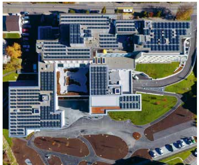
Mai 2017: Photovoltaik-Anlage auf den GERBE-Dächern.

Am 23. 6. 2018 wird der Erweiterungsbau offiziell eröffnet und eingeweiht, verbunden mit einem «Tag der offenen GERBE» für die Öffentlichkeit und dem Feiern des 40-jährigen GERBE-Betriebsjubiläums.