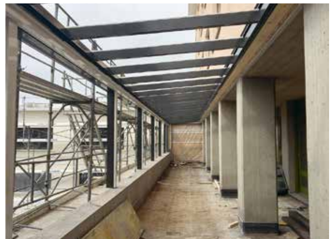
11. 5. 2017: Durchgang (noch ohne Verglasung) zu Haus 3.