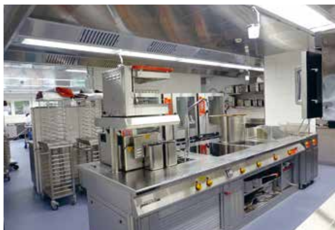
9. 11. 2015: Die neue GERBE-Küche ist betriebsbereit.