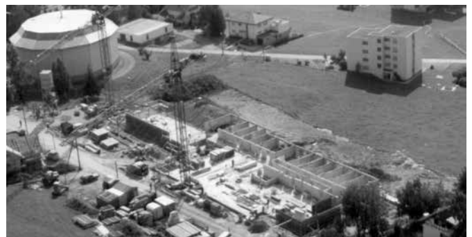
Der Bauplatz kurz nach Baubeginn am 29.4.1976.