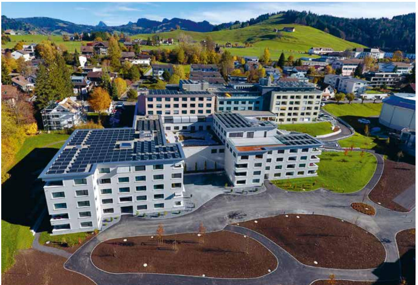
25. 10. 2017: Die Bauarbeiten sind weitgehendst abgeschlossen.