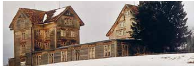
Die «Gerbe» am 25.3.1962.

Am 1.4.1978 traten die ersten vier Bewohner ins Altersheim ein. Bis Ende 1979 war das Altersheim voll belegt. Die offizielle Eröffnung der GERBE wurde am 22.4.1978 gefeiert, verbunden mit der Einweihung der Hauskapelle und anschliessenden anderthalb Tagen der «Offenen Tür».