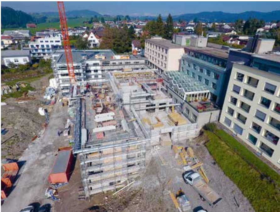
22. 9. 2016: Die Baustelle aus der Drohnenperspektive.