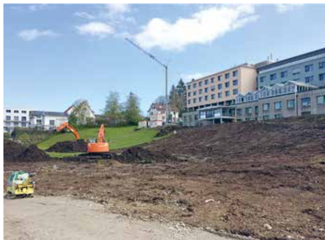
Nur 12 Tage später: Die ersten Bagger sind aufgeföhren.