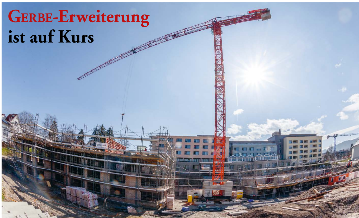
Anfang April 2016: Der Erweiterungsbau mit Blick Richtung GERBE (oben) bzw. von der GERBE aus gesehen (unten).