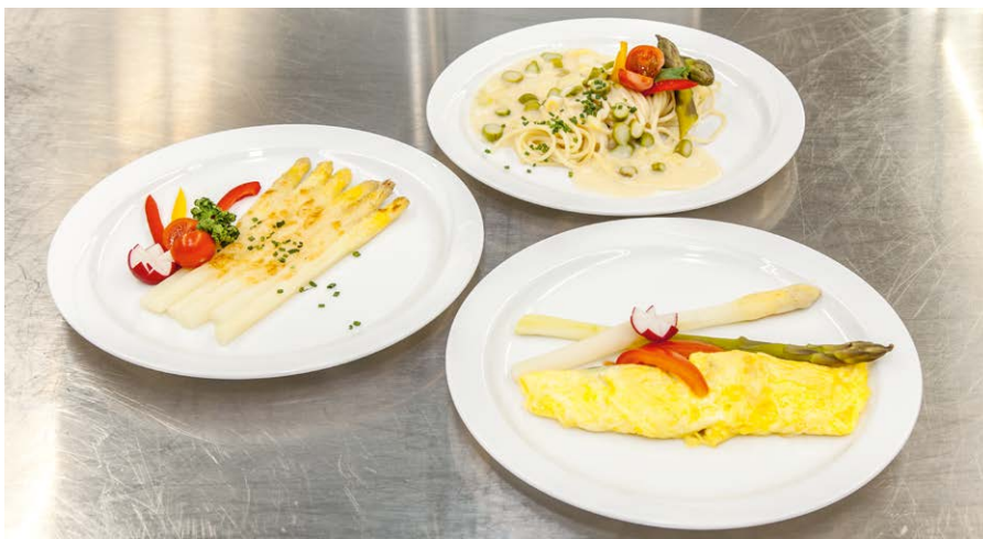
Neu ist der thematischen Wochenhit in drei Variationen, hier z. B. Spargeln.